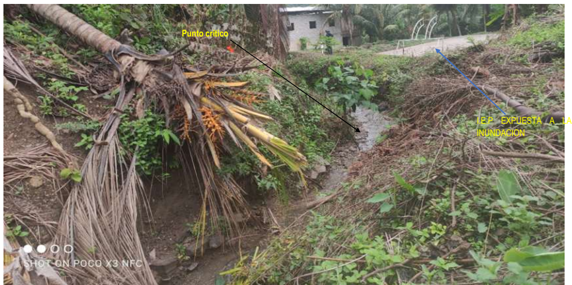
F-02: Tramo crítico en la quebrada Martin Huaycco, el cual expone con riesgo de inundación a la I.E.P. de Villa Unión, distrito de Anchiuay, Provincia de La Mar - Ayacucho.