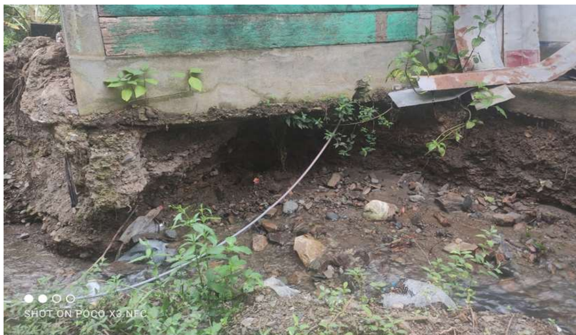
F-03: Cimentación erosionada, de la I.E. de Villa Unión.