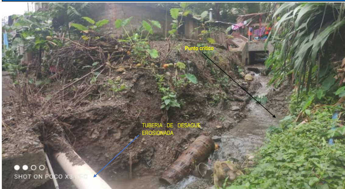
F-01: Tramo crítico en la quebrada Martin Huaycco, centro poblado de Villa Unión, distrito de Anchihuay, Provincia de La Mar - Ayacucho.